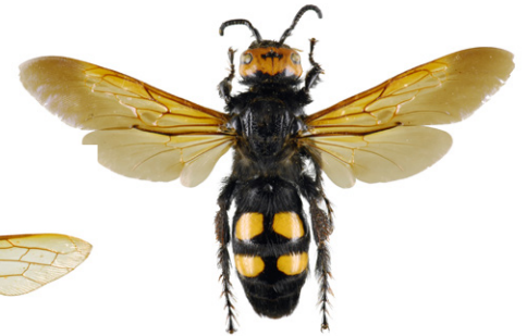
Rotstirnige Dolchwespe, Megascolia maculata

Die Riesenholzwespe , Urocerus gigas , ist eine Pflanzenwespe deren Larven sich von Holz ernähren. Diese schwarz-gelb gefärbte Wespe ist durch ihren zylindrischen Körper und ihre langen, einfarbig gelben Fühler, leicht von Hornissen zu unterscheiden. Weibchen können 45 mm lang werden und besitzen einen langen Legebohrer, der es ihnen ermöglicht, Eier in Holzstämmen abzulegen. Die Riesenholzwespe ist völlig harmlos.