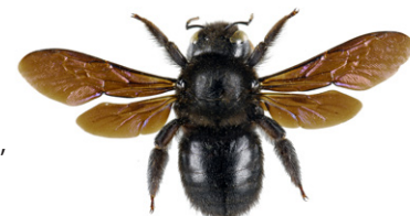
Blaue Holzbiene, Xylocopa violacea

Die Blaue Holzbiene , Xylocopa violacea , ist 20 bis 30 mm lang, vollkommen schwarz gefärbt und schimmert violett-blau. Die Weibchen dieser Solitärbieneart bauen ihre Nester in mürbem Totholz und sammeln Pollen als Nahrung für ihre Brut.