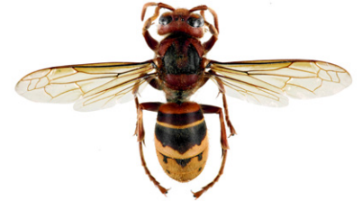
Europäische Hornisse, Vespa crabro

Die Orientalische Hornisse , Vespa orientalis , entspricht in der Körpergröße der Europäischen Hornisse. Sie hat eine rotbraune Grundfärbung, lediglich die Kopfvorderseite sowie eine Binde um den Hinterleib sind gelb. Sie kommt nur in Südosteuropa vor (Süditalien, Malta, Albanien, Griechenland, Zypern, Rumänien, Bulgarien).